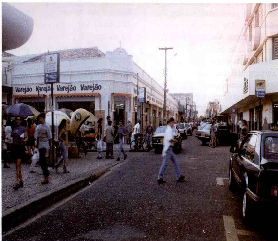
Segurança do centro de Teresina é preocupação do comércio lojista