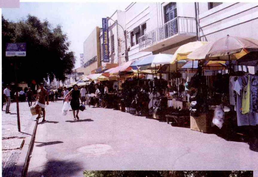
Os camelôs da Coelho Rodrigues (foto acima) serão deslocados para o lugar dos taxis da praça Rio Branco (foto abaixo)