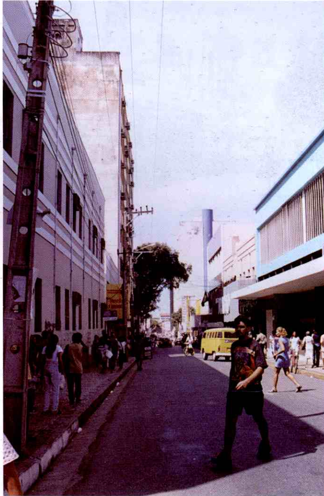
Revitalização: a Rua Rui Barbosa será a primeira.